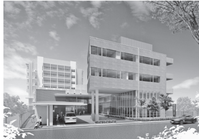
増築完成予想図(平成24年11月末予定)

当院をご利用いただきありがとうございます。 新病院となり4年が経過しました。利用して下さる患者様が年々増加している中、外来診療スペースも過密となり、利用者の皆様には大変ご迷惑をお掛けしております。