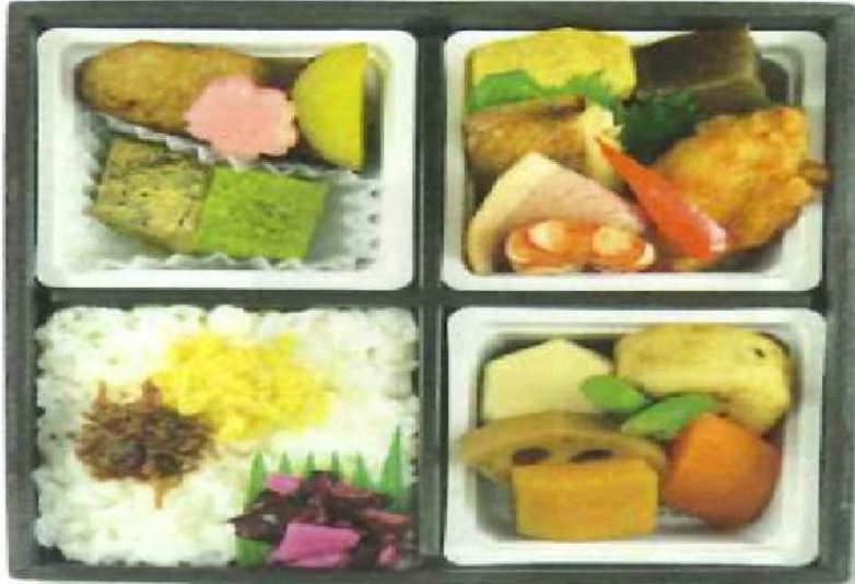
箱サイズ 18.0cm×18.0cm×高さ 4.5cm(外寸)