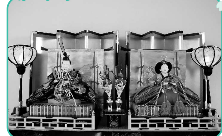
3月9日は「上巳(じょうし)」「桃の節句」と言われ、厄を人形に移して祓った「流し雛」の風習がありました。それらが発展し、雛人形を飾り女の子の健やかな成長と幸せを願う現在の「雛祭り」となりました。C3病棟には患者さまから寄付いただきました立派な雛壇が飾られました。