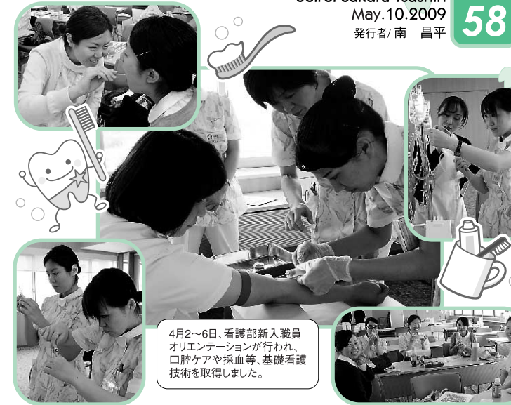
4月2～6日、看護部新入職員オリエンテーションが行われ、口腔ケアや採血等、基礎看護技術を取得しました。