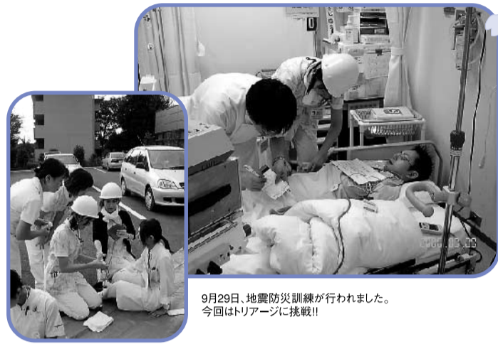
9月29日、地震防災訓練が行われました。今回はトリアージに挑戦!!