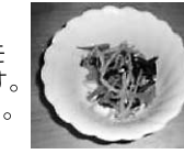
管理栄養士 新井 理恵 / 大口 純加