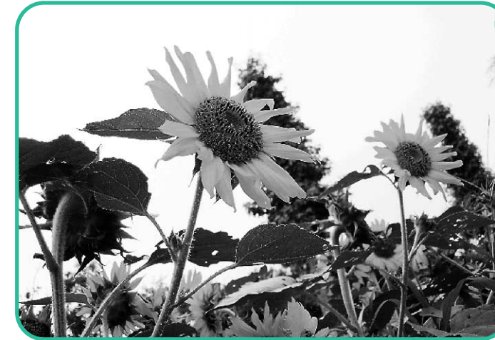
夏 爽々盛り!! ひまわりのように元気一杯過ごしましょう。

Seirei Sakura Tsushin vol. 25 Aug. 10. 2006 発行者/南 昌平