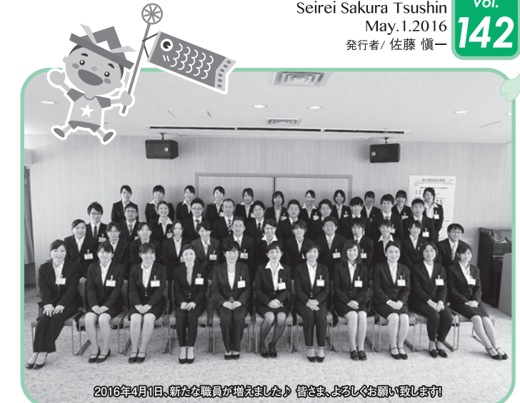
2016年4月1日、新たな職員が増えました!皆さま、よろしくお願ひ致します!

Seirei Sakura Tsushin May.1.2016 vol.142 発行者/佐藤 慎一