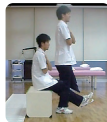
立ち上がりテスト