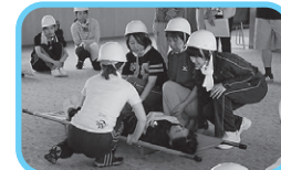
2016年6月4日(土)、新人防災訓練を行い、災害時に必要な知識・行動を習得しました。