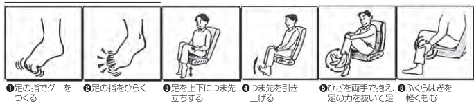
①足の指でグーをつくる ②足の指をひらく ③足を上下につま先立ちする ④つま先を引く ⑤ひざを両手で抱え、足の力を抜いて足 ⑥ひざを上げて、軽くもむ首を回す

参考文献: 医療情報科学研究所. 病気がみえる呼吸器. 東京. メディックメディア. 2007. 213p.