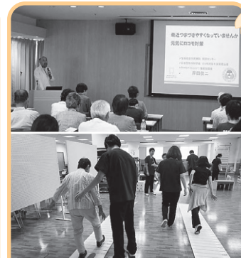
2016年7月16日(土)、聖隷リハビリフェアを開催致しました。整形外科医の講演と理学療法士によるロコモ度テスト・体操を行いました。