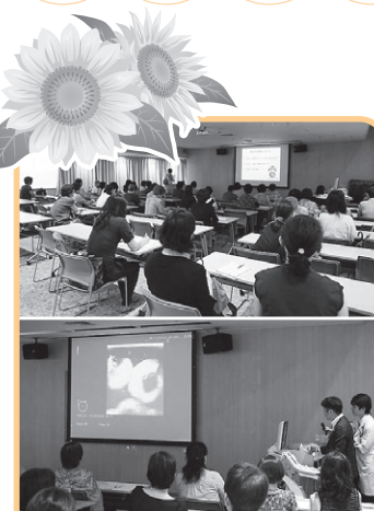
2016年7月9日(土)、2016年度第1回市民公開講座が開催されました。今回は、医師・臨床検査技師の講演とエコーの実演を行いました。