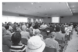
第2回市民公開講座の様子

どなた様でもご参加頂けます。皆さまのご来場お待ちしております。 ☆参加無料・申込不要・定員100名 お問い合わせ: ☎043-486-1151(代) 総合企画室