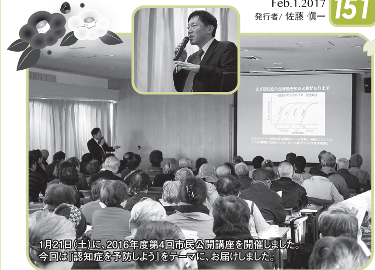
1月21日(土)に、2016年度第4回市民公開講座を開催しました。今回は「認知症を予防しよう」をテーマに、お届けしました。