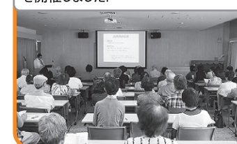
10月14日(土)に「アイアイフェア2017」を開催しました!