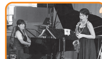
10月7日(土)、ロビーコンサートを開催しました!