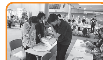
9月30日(土)に「アイアイフェア2017」を開催しました!