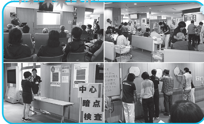
10月19日(土)、当院1階ロビーで「アイアイフェア2019」を開催しました。