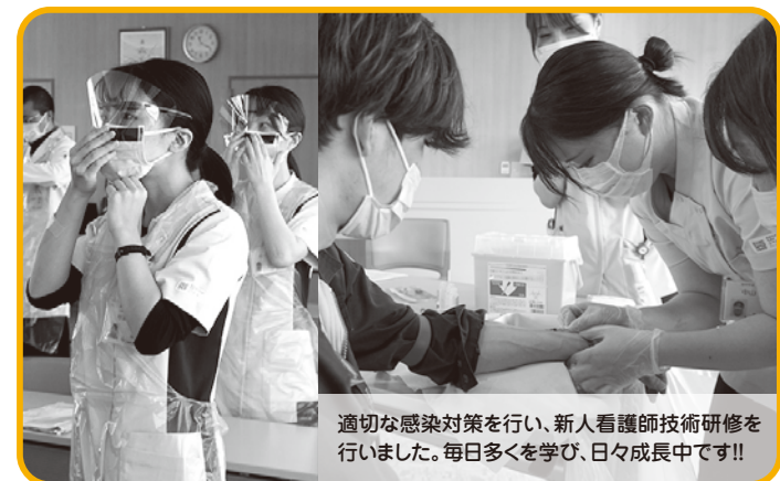
適切な感染対策を行い、新人看護師技術研修を行いました。毎日多くを学び、日々成長中です!!