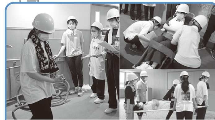
6月18日(土)新人防災訓練を行い、災害時に必要な知識・行動を習得しました。