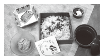
2021年度七夕メニュー