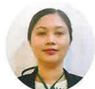
宝塚すみれ栄光園 4F ジャッキー