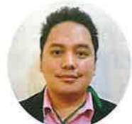
ケアハウス宝塚 6F マーク