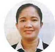
ケアハウス宝塚 5F エリ