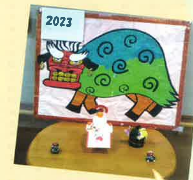
良い年 になります ように