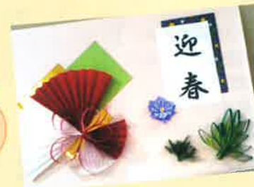
あけまして おめでとう ございます