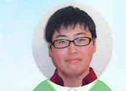
所属 趣味・特技 ケアハウス宝塚 音楽・映画・ 6階 漫画・バイクが 介護職 好きです。 介 よろしくお願 いいたします!