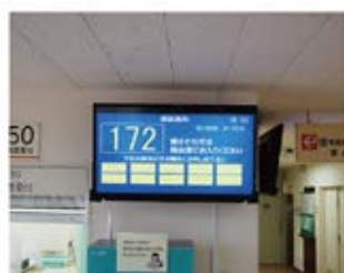
採血案内モニタ ご案内の準備ができましたら、 整理券番号が表示されます

予約日に変更がある場合や、細菌検査、持参検体がある方、ご不明な点がありましたら検査受付担当者にお声掛けください。