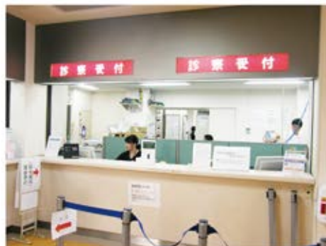
当院1階にある診察受付へご提示をお願いします