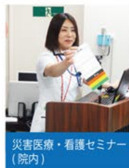
災害医療・看護セミナー (院内)

患者さまが、「何を求めているのか」をよく聞き「必要なことは何か」を考え「行うべきことは何か」を予測し、看護師として「何ができるか」を計画し実践するようにしています。救急では、患者さまの生活状況や健康管理に関する情報を限られた時間で把握し、効果的に介入を行なう必要がありますが、一方的に必要な情報を提供するだけでなく、その人がみずからの生活に適用させ実行できるような健康管理のご説明を心がけています。