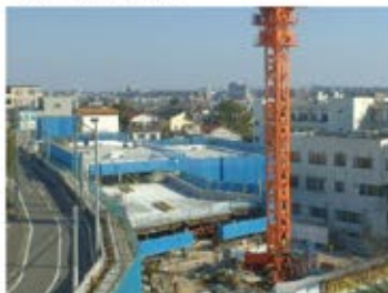
内装工事 開始 立体駐車場の完成まであと少し！