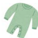
診察室隣には 広々とした授乳スペース