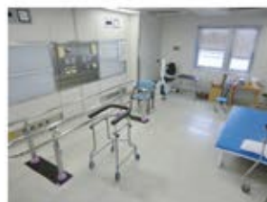
地域包括ケア病棟の リハビリテーション室風景

それらを元にリハビリの内容や負荷を決めて、入院生活を元気に送っていただけるように関わっております。