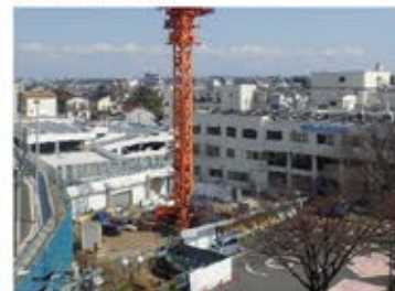
立体駐車場 完成・オープン！ ご理解・ご協力ありがとうございました。