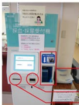
こちらから尿カップが発行されます