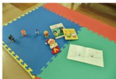
↑待合室には プレイスペースもあります