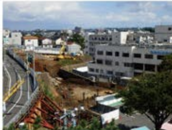
横浜エデンの園さんのご協力のもと 工事の全体撮影を始めました。