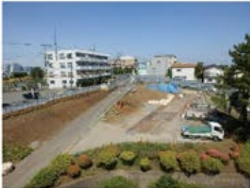
立体駐車場 工事スタート！