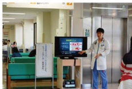
熱意ある医師が揃っております

日頃から健康に不安がある、という方は講座後に診察のご予約もできますので、お気軽にお立ち寄りください。当院の心臓血管センター内科では地域屈指の最新画像診断設備を用いた診断・治療ができ、24時間365日の対応が可能です。また、大変志の高い医師やスタッフが揃っております。受診にあたり不安をお抱えの方は、この講座を通じてご自身の健康を考えるきっかけにはいかがでしょうか。