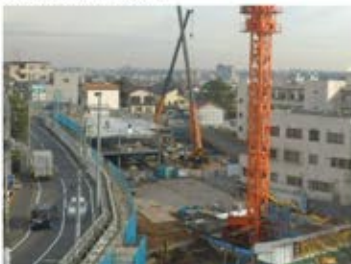
着々と駐車場の姿になってきました