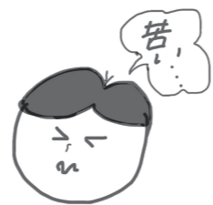
小児がオレンジジュースで粉薬を服用し苦味を感じている