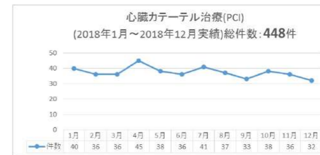
心臓カテーテル治療 (PCI)

高齢患者さまになるほど、様々な疾患を併発します。循環器専門だけの疾患治療では、患者さまに満足していただける医療は提供できません。そこで、総合的な医療の提供のため、内科系様々な診療科との風通しの良い連携をはかり、共同での講演会などを定期開催しています。特に心不全には肺炎・COPDといった呼吸疾患の合併が多く認められますが、専門的かつ包括的医療の提供を考慮し、今夏より呼吸器内科とコラボした入院診療を開始しました。また当院自慢の優秀なスタッフの多い、リハビリ・薬剤・看護・CE・放射線技師部門とも協力しあい、チーム医療を提供しています。多くのスタッフのサポートの結果、各種治療においても、手技に伴う重篤な合併症の発生が少ないことが特徴と言えるかと思えます。得意とする心臓カテーテル治療(PCI)、下肢のカテーテル治療(PTA)のみならず、2年前からは不整脈に対する根治治療としてカテーテルアブレーションも開始していますが、上記スタッフの協力で現在まで全例で初期成功を得ています。