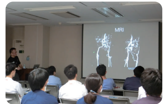
他病院より先生を招き勉強会を開催しています。