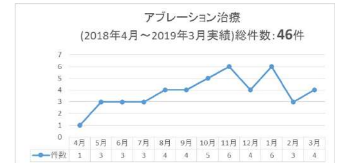
アブレーション治療