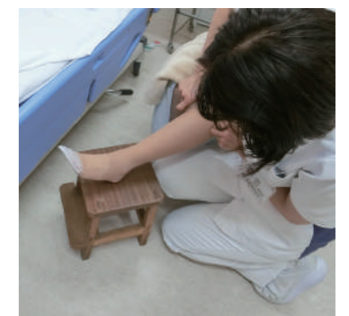
ストッキングを履いた圧迫療法