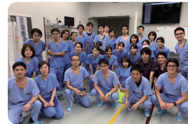
外部研修にて、チームの結束を高め、医療の質の向上を目指しています。