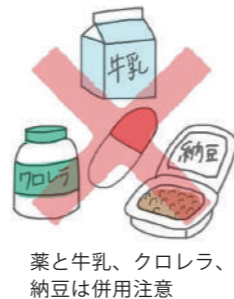
薬と牛乳、クロレラ、納豆は併用注意

また、小児用の粉薬には苦味を感じさせないためにコーティングされているものがあります。薬を飲みやすくするためにオレンジジュース等の酸性飲料で服用するとかえって苦味が増してしまうものもあります。薬の相互作用や飲み合わせで不安なことがありましたら、遠慮なく薬剤師にご相談ください。