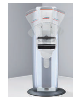
SIEMENS 社 MAMMOMAT Revelation

生活習慣や喫煙、糖尿病などにより同じ年齢でも血管の状態には個人差がでます。動脈硬化は30代から始まると言われています。まだ大丈夫と油断せず、一度検査を受けてみてはいかがでしょうか。