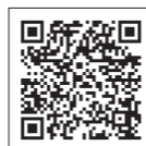
聖隷横浜病院公式 YouTubeチャンネル QRコード