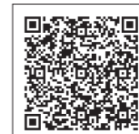
ドック・健診室のご案内

【ご予約・お問い合わせ】 ドック・健診室 045-715-3158 【ご予約受付時間】 平日 10:00~11:00/13:00~16:30 第2、第4土曜 8:30~11:30