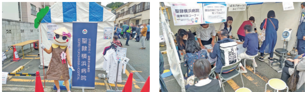
2023年度第31回保土ヶ谷宿場まつりの様子

地域の皆さまとの交流を深め、医療や病気について知っていただくことを目的とした体験・相談コーナーなど出展をします。