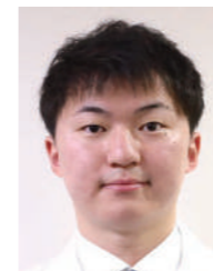
りすん なるか 李 昇讚 整形外科