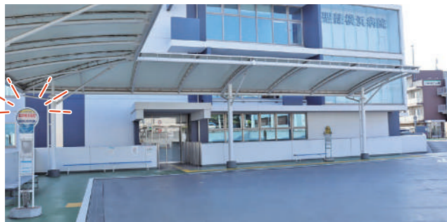
バス停留所位置；正面玄関前 横浜市営バス 循環路線バスと同じバス停留所です。