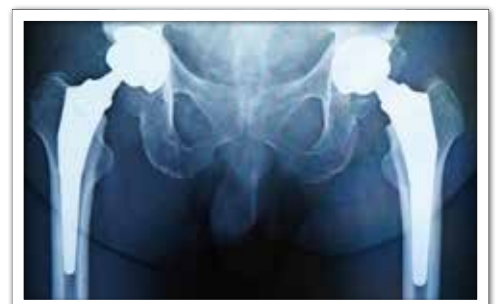
両脚人工股関節置換術後のレントゲン

私は手術する前の術前計画を重要視しています。どんな形状やサイズの人工股関節を選び、どういう方向、角度で、どうやって設置するか、足の長さをどう調整するかなど、時間をかけてしっかりとしたイメージを構築しておきます。