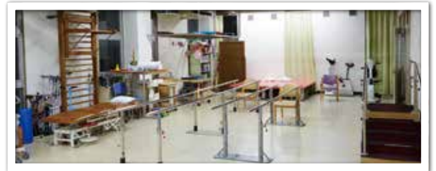
リハビリテーション室

手術後1カ月の間は、特にしっかりリハビリを続けてください。かつて、脱臼を心配して動作制限がありましたでしたが、私は全く制限していません。脱臼が起こりやすい姿勢は、入院中に何度も何度も伝えて注意してもらいます。そのことを頭に置いたうえで、家に帰ってからは何をしてもいいのです。