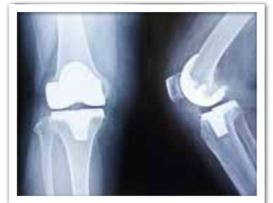
人工膝関節置換後のレントゲン (正面と側面)

股関節の状態が悪い方は、ひざも悪くなっている方が多くいらっしゃいます。私は、ひざ人工関節の手術も行っていますので、股関節、ひざ両方の状況を確認しながら、治療にあたるようにしています。