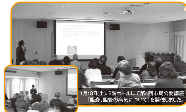
1月18日(土)、6階ホールにて第4回市民公開講座「胆嚢、胆管の病気について」を開催しました。