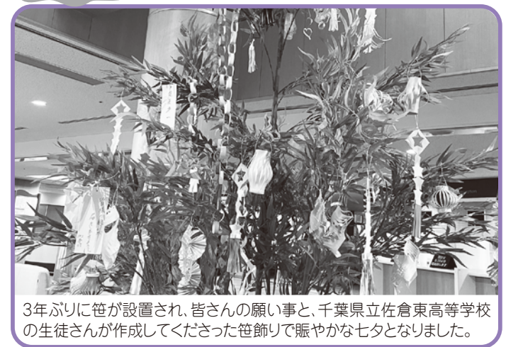
3年ぶりに笹が設置され、皆さんの願い事と、千葉県立佐倉東高等学校の生徒さんが作成して下さった笹飾りで賑やかな七夕となりました。

Seirei Sakura Tsushin vol. 229 Aug.1.2023 発行者/鈴木 理志