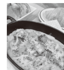
シーフードグラタン