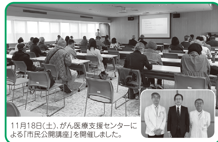
11月18日(土)、がん医療支援センターによる「市民公開講座」を開催しました。