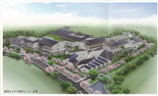
聖隷おおぞら療育センター全景

開放的かつ、障害をもつ人たちの暮らしやすさを重視し、職員の配置や建物設備、各施設の連携なども考慮した設計になっています。